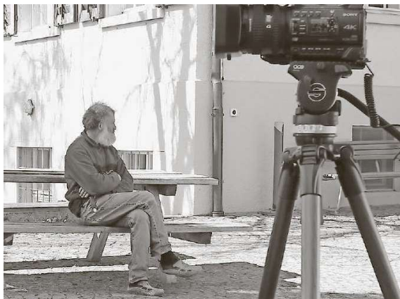
Beni Federer porträtiert in seinem neuesten Filmprojekt einen langjährigen Bewohner des WWW.

Die Vorführung von «Alleine in Gemeinschaft» startet nach der Jahresversammlung um ca. 20.15 Uhr im Weid-Saal und dauert 30 Minuten. Danach sind alle herzlich eingeladen,