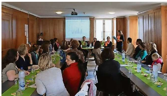
An der Mitgliederversammlung am 13. April wird auch die zukünftige Finanzierung Thema sein.

Die diesjährige Mitgliederversammlung steht im Zeichen der grossen Herausforderungen, die 2018/19 auf das Familienzentrum zukommen werden. Mit der Kündigung der Leistungsvereinbarung durch die Fachstelle für Integrationsfragen des Kantons, ist letztes Jahr überraschend eine wichtige finanzielle Stütze weggebrochen. Obwohl einige Bezirksgemeinden ihre finanzielle Unterstützung zugesagt haben, mussten bereits im Herbst 2017 schmerzhafte Anpassungen im Betrieb und eine Kürzung der Dienstleistungen für Familien eingeleitet werden. Sollte kein Ersatz für die nun fehlenden Mittel gefunden werden, ist der Fortbestand des Familienzentrums akut gefährdet. Hilfe und finanzielle Unterstützung werden