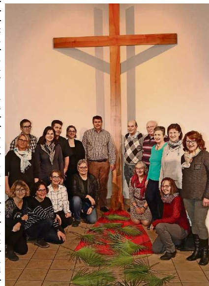
Zum zweiten Mal gastiert der Projektchor «Good News Singers and Band» in Obfelden.

Weitere Konzertdaten sind: Gründonnerstag, 29. März, 20 Uhr, reformierte Kirche Ulitikon; Karfreitag, 30. März, 17 Uhr, evangelische Freikirche Zug in Steinhäusern; Karsamstag, 31. März, 19 Uhr, Chrischona Affoltern.