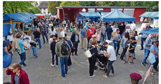
Die Einnahmen des Herbstmärt werden gespendet.

Egal ob Wurst, Raclette oder Pommes, es hat für jeden Geschmack das passende Angebot. Magenbrot, Marroini, Zuckerwatte – das kulinarische Verwöhnprogramm ist beliebt. Ein Hit