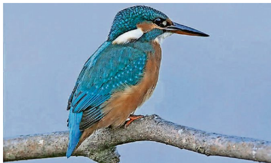
Mit etwas Glück zeigt auch er sich: der Eisvogel.

Samstag, 28. September, ab 9 Uhr, Dauer: zirka 2 1/2 Stunden. Durchführung bei jedem Wetter. Unkostenbeitrag für Nichtmitglieder: 5 Franken. Weitere Infos auf www.naturnetz-unterramt.ch .