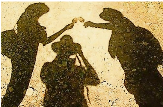
Spiel mit Licht und Schatten.

Schon seit 2000 Jahren spielen die Menschen im asiatischen Raum Schattentheater, denn das Spiel mit Licht und Schatten ist sehr vielseitig und spannend. Die Kasperlibühne Zipfelmütze hat sich etwas ganz Besonderes einfallen lassen und zeigt am Samstag, 2. November, um 14.30 Uhr im Familienzentrum Affoltern ein Stück als Schattentheater. An diesem Nachmittag ist zudem das Kafi geöffnet. Das Team serviert feine Köstlichkeiten und