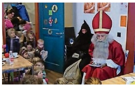
Der Samichlaus kommt.

Das Kafi ist von 14 bis 17 Uhr geöffnet, der Samichlaus kommt um 16.30 Uhr. Kosten: 5 Franken pro Samichlaussäckli. Infos per Tel. 044 760 12 77 oder auf www.familienzentrum-bezirk-affoltern.ch .