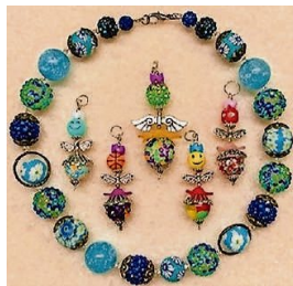
Im Kurs kreieren die Teilnehmenden ein eigenes Schmuckstück.