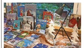
Es warten tolle Bücher. (Bild zvg.)

«Wer hat Weihnachten geklaut?», heisst es am 4. Dezember in der Bibliothek Stallikon. So lautet nämlich der Titel einer Adventsgeschichte, die alle Kinder zwischen 5 und 7 Jahren auf die festliche Zeit einstimmen soll. Natürlich wird an diesem Nachmittag auch gespielt, und sogar der Samichlaus wird einen Besuch machen. Er ist gespannt auf viele Versli und bringt neue Bilderbücher, Spiele und Chlaussäckli. Der Anlass ist kostenlos. Eine Anmeldung ist nicht erforderlich. Das Bibliotheksteam freut sich auf viele leuchtende Kinderaugen. (pd.)